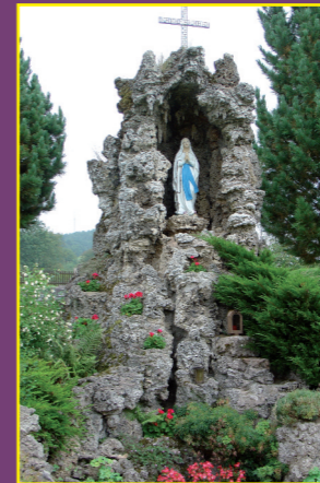
Lourdesgrotte, erbaut 1907