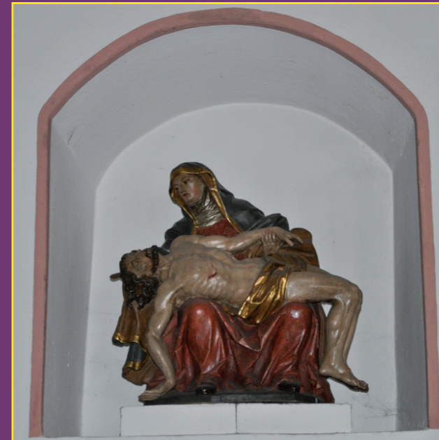
Pietà ca. 16. Jahrhundert

Ein Neubau wurde geplant. Nur woher sollte die kleine, arme Gemeinde dafür das Geld aufbringen?