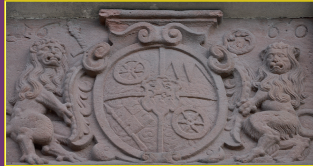
Wappen des Erzbischofs und Kurfürsten Johann Philipp von Schönborn

Sein Wappen ist in rotem Sandstein über dem Eingang der alten Kirche angebracht.