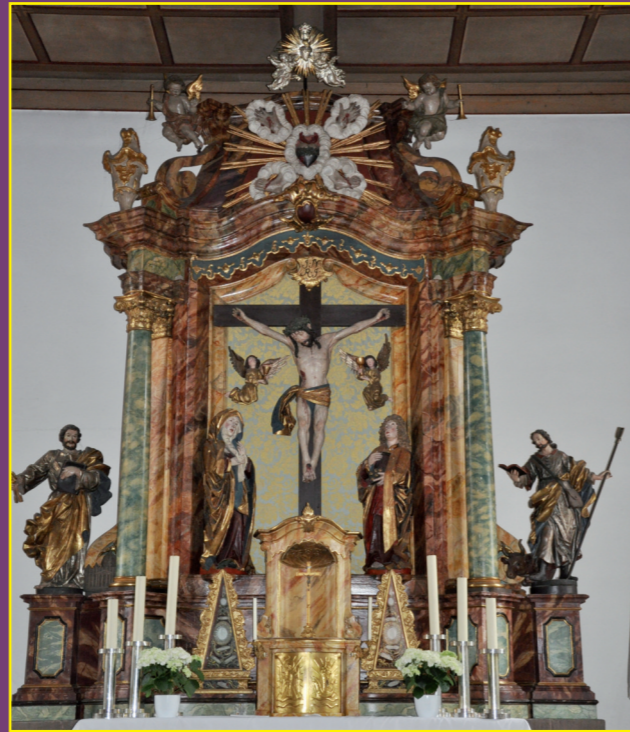
Kreuzigungsgruppe aus der Riemenschneider-Schule, links: Hl. Petrus, rechts: Hl. Wendelinus.

Die Orgel erhielt ihren neuen Platz auf der heutigen Empore. Sie wurde 1892 von dem Orgelbaumeister Fritz Clewing in neugotischem Stil erbaut. 1981 wurde sie überarbeitet und mit einem zweiten Manual versehen. Bei einer erneuten Überarbei-