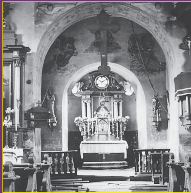
Alte Kirche 1671 – Blick auf den Hochaltar

Im Dreißigjährigen Krieg wurde unser Kirchlein fast vollständig zerstört. Zwölf Jahre nach Kriegsende im Jahr 1660 schrieb der Erzbischof und Kurfürst Johann Philipp von Schönborn (1647 – 1673) in einer Anordnung: „dass in unserem Flecken Mernes die eingefallene Kapelle, etwas größer als gewesen, wieder aufgebaut werden soll.“