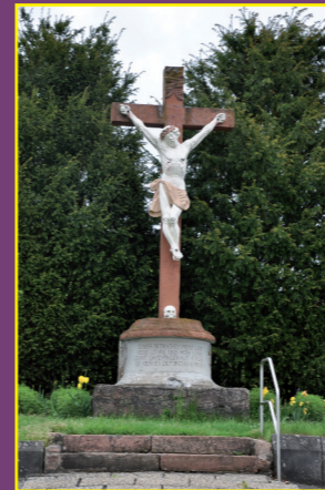
Friedhofskreuz anno 1793

Die Fresken, die Ausmalung der Kassettendecke und der Schrifttext am Chorbogen wurden entfernt und die Kirchenbänke ersetzt. Dies erfolgte im Zusammenhang der Liturgiereform des II. Vatikanischen Konzils. Die Gemeinschaft mit Christus – so wie Christus mit seinen Jüngern am Gründonnerstag Mahl gehalten hat – sollte im Vordergrund stehen. Die Ausschmückungen der Kirche schienen von diesem zentralen Geschehen abzulenken.