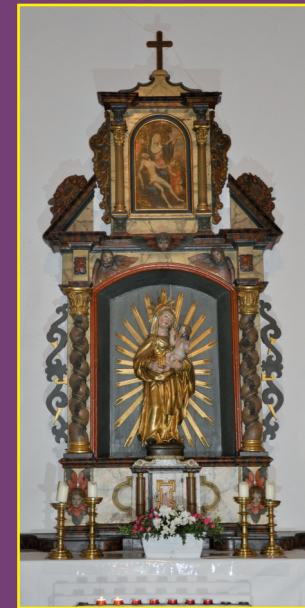
Marienaltar aus Lettgenbrunn

Ein Schrifttext schmückte den Bogen zum Chor: „Seid wachsam, steht fest im Glauben, handelt männlich und seid stark.“