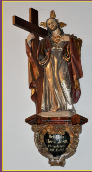
Herz-Jesu-Figur unbekannter Meister

Grundriss ist jetzt die Kreuzform. Das Längsschiff der alten Kirche wird zum Querschiff der neuen Kirche, dem sich der neue Chorraum anschließt. Der ehemalige Chorraum wird Taufkapelle. Die Decke wurde getäfelt – eine vornehm wirkende Kassettendecke, die in den einzelnen Feldern mit christlichen Symbolen ausgemalt war. Der barocke Hochaltar zeigt eine eindrucksvolle Kreuzigungsgruppe.