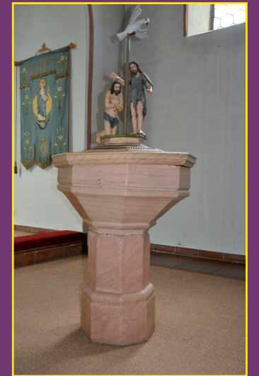
Taufstein aus Lettgenbrunn

Den unermüdlichen Bemühungen und dem Weitblick des damaligen Seelsorgers, Kuratus Feußner, der 1932 die Kuratie übernahm, ist es zu verdanken, dass bald nach seinem Amtsantritt 1933 mit dem Erweiterungsbau begonnen werden konnte. Der