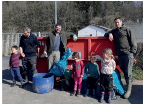
Eine der vier Müllsammelgruppen des Angelvereins Marjoß mit einem Teil des Mülls

nahes Gewässer erhalten. Appelle an die schwarzen Schafe, welche die Jossa als Müllkippe missbrauchen – insbesondere bei Hochwasser – verhallen ungehört und aller hohen Bußgelder zum Trotz. Doch es gibt auch etliche Fälle von unwissentlicher Bachverschmutzung: Manch Landwirt und Grundstücksbesitzer in der Feldflur ist hier gefragt, achtsamer mit Kunststoffmaterialien in der Gemarkung umzugehen. Als Gartenbesitzer sollte man darauf achten, insbesondere bei Sturm und/oder Hochwasser keine Materialien aus Plastik im Garten ungesichert zu belassen. Hundekottüten sind aller Ehren wert – aber nur, wenn sie im Restmüll und nicht in der Landschaft entsorgt werden. Und schließlich sollten wir alle für unsere Kinder Vorbild sein und auch nicht ein noch so kleines Bonbonpapier achtlos auf den Boden werfen. Oder noch besser: Beim Spaziergang einfach mal den ein oder anderen Plastikfetzen einstecken und zu Hause in der Mülltonne entsorgen.