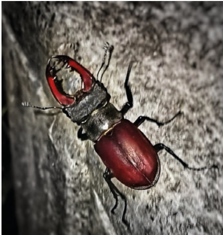
Männlicher Hirschkäfer