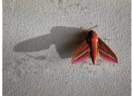
Mittlerer Weinschwärmer

Seit einiger Zeit ist das Wort Insektensterben in aller Munde und regelmäßig in Presseberichten zu finden. Der Begriff Insektensterben bezeichnet den Rückgang der Zahl bzw. Biomasse der Insekten und/oder der Artenzahl von Insekten in einem Gebiet; sicherlich mit bedingt durch die Ausbreitung des Menschen und dessen intensiver Landnutzung. Um dagegen anzugehen, investiert zum Beispiel das Land Hessen in diesem Jahr mehr als zwei Millionen Euro für rund 5.000 Hektar Blühflächen, die Landwirte als Blühstreifen oder -flächen angelegt haben. Aber auch jeder einzelne von uns kann ohne viel Aufwand in Insektenfreundlichkeit investieren: einfach im Garten der Natur mehr Raum geben. Und wer dann noch genau hinschaut, kann spannende Entdeckungen machen: