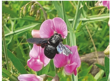
Blaue Holzbiene an einer Wicke