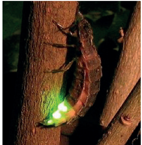
Braucht die Dunkelheit: Das Glühwürmchen

brauchen (z.B. wilde Möhre, Beifuß, Distelarten, Königskerze, Goldrute, Steinklee, Klette u.v.a.) Diese „Ruderalvegetation“ ist ein Eldorado für Insekten (z.B. Hummeln, Wildbienen, Schmetterlinge etc.), die wiederum die Nahrungsgrundlage für viele andere Arten bilden. Leider werden Ruderalstellen - zu denen man auch Wegränder und Raine zählen kann - von vielen als „ungepflegt“ wahrgenommen und infolgedessen etwa durch Schottern, Pflastern o.ä. beseitigt. Lasse ich als Privatmann oder als Gemeinde Ruderalstellen zu, fördere ich die Artenvielfalt.