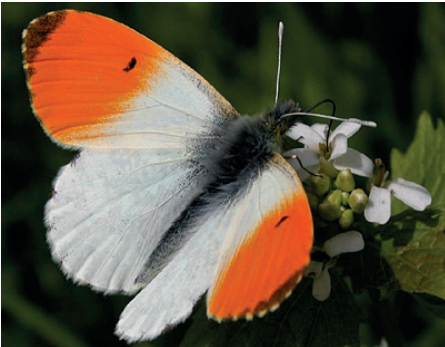
Braucht das Wiesenschaumkraut: Der Aurorafalter

Was ist die größte Gefahr für die Existenz der Menschheit auf dem Planeten Erde? Sicherlich wird vielen als Erstes der Klimawandel als Antwort in den Sinn kommen - und das ist ja auch nicht falsch. Dennoch sind sich viele Evolutionsbiologen darüber einig, dass es nicht in erster Linie der Klimawandel ist, der die Existenz der Menschheit bedroht, sondern der rasante Verlust an Biodiversität. Immer mehr Tier- und Pflanzenarten sterben in immer kürzeren Abständen aus oder gehen in ihren Beständen bedrohlich zurück. Die Ursachen hierfür sind vielfältig und haben grundlegend mit unserer Art zu wirtschaften zu tun. Der Klimawandel wirkt dabei zusätzlich als Brandbeschleuniger. Fakt ist: Die Wechselwirkungen zusammenbrechender Nahrungsketten, fehlender Bestäubungsleistung und genetischer Verarmung werden, wenn es so weiter geht, irgendwann - auch bei uns - auf die Nahrungsmittelversorgung des Menschen durchschlagen.